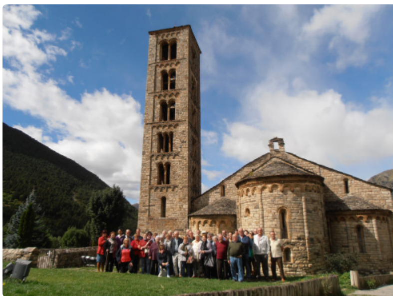
Iglesia San Climent de Taüll (valle de Bohí)

Hacia el final de la jornada, estábamos todos un poco cansados, pero contentos del día que habíamos pasado juntos y esperando que llegue el próximo año para realizar una nueva salida.