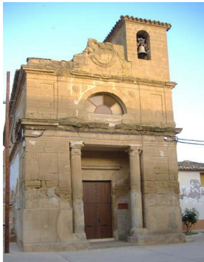
Iglesia de Monflorite

allí, no, a través de reuniones y sesiones informativas fueron acercándose a los pueblos de la comarca para ilusionar a otras tantas mujeres que vieron en ellas, lo que siempre habían añorado: actividades y poder compartir con otras mujeres de otros pueblos complicidades. Así que como una centella fueron llegando a distintos pueblos cercanos a la capital, llegando a tener en el año 2006, 444 asociadas, de unos 20 pueblos de la Hoya, por lo que se convirtieron en una de las asociaciones más importantes del Altoaragón. Posteriormente y a petición de algunas asociadas la Junta decidió que los hombres también pudieran formar parte de la Asociación, porque no podían dejarlos al margen de este emergente movimiento, ni actuar de la misma manera con lo que ellas se habían encontrado en muchas ocasiones. Esta apertura dio un resultado satisfactorio y entrañable. Sin embargo, no fueron en el pasado ni lo son en la actualidad importantes por el número de asociados, nos engañaríamos nosotros mismos y a la historia, si pensáramos así. La Asociación goza de gran respeto y consideración en la sociedad por