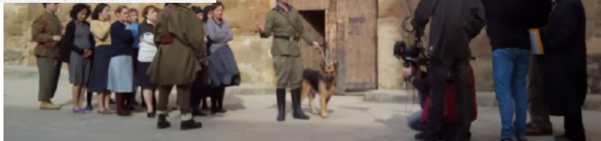
Grabación de “Lágrimas de mujer”