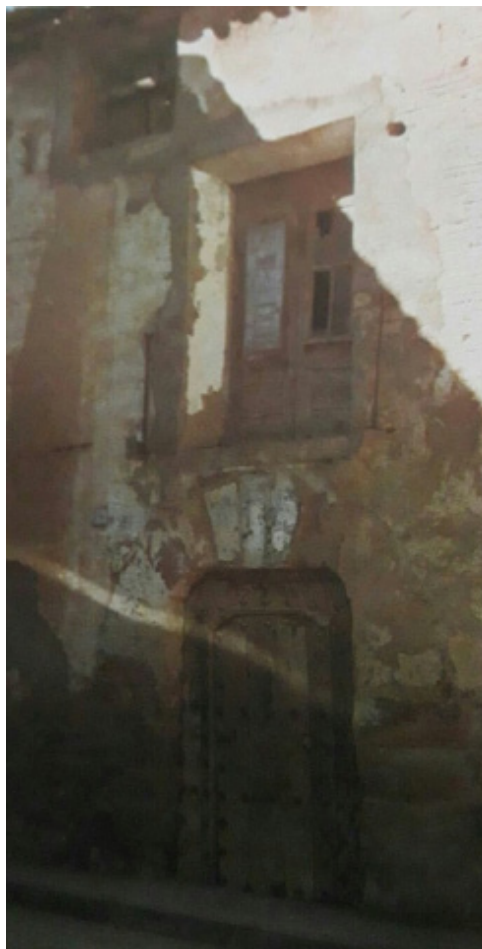
CASA RECTORAL DE CASBAS

La secretaría la regenta desde sus inicios y