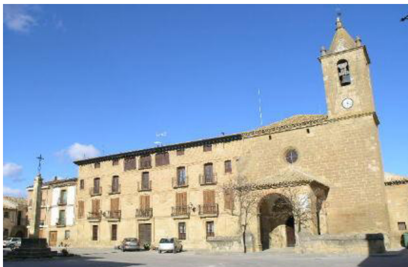
Iglesia de Siétamo