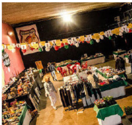
Rastrillo de la asociación