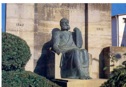
Escultura de Joaquín Costa en Graus

“un cura de pueblo que esta Villa tuvo el honor de tener a finales del siglo XIX y principios del siglo XX, y que sin querer fue el fundador y pionero sin quererlo de las Cajas Rurales en España.”