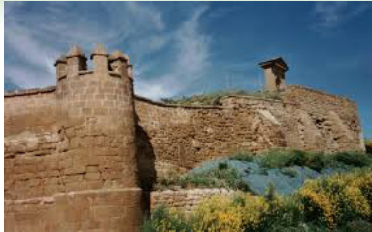
Muralla de Siétamo