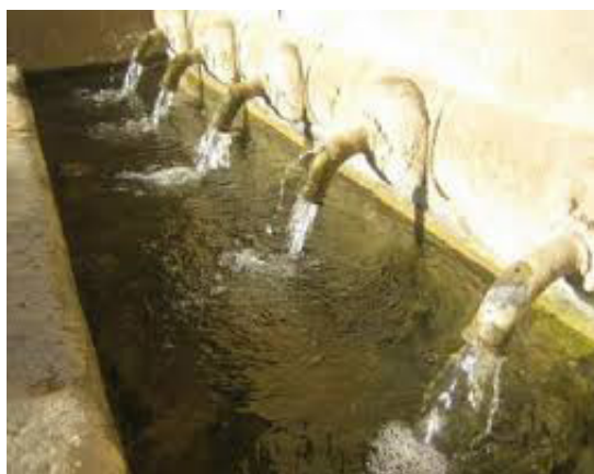
Fuente de Siétamo