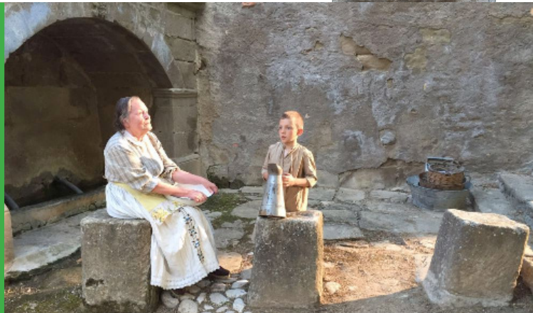
Rodaje de la película "Incierta Gloria"