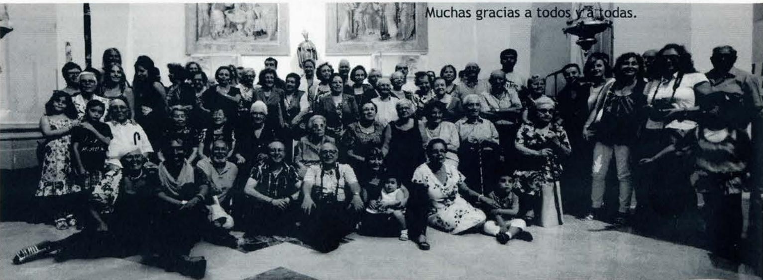
Muchas gracias a todos y a todas.