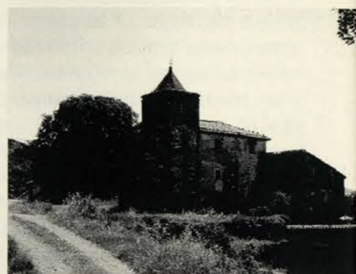
1. Yaso; 2. Restos de la ermita de la Virgen de la Sierra; 3. Paisaje desde tierras de Yaso; 4. Iglesia de San Román