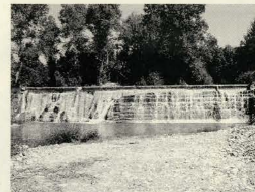
Azud en el río Formiga