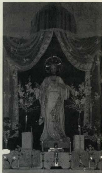
Sagrado Corazón de Jesús