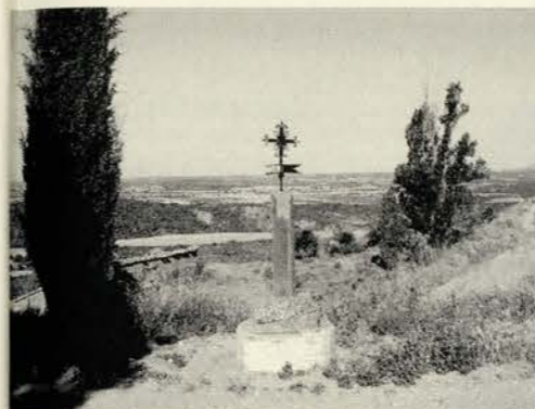
Crucero en San Román

Con la finalidad de acercarnos a la ermita de la Virgen de la Sierra, tomamos una pista dirección norte que parte unos metros más arriba de la salida del pueblo. En dicha pista hay tramos en los cuales sube con fuerte pendiente ganando altitud con rapidez, lo cual nos permite disfrutar de una bella panorámica, también podemos observar el