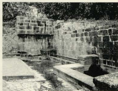
Fuente de San Román