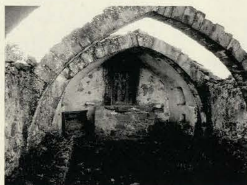
"Entre monte bajo y carrascas llegamos a los restos de la ermita de la Virgen de la Sierra"

"al oeste nuestra fiel compañera de viaje la sierra Guara con su color azulado"