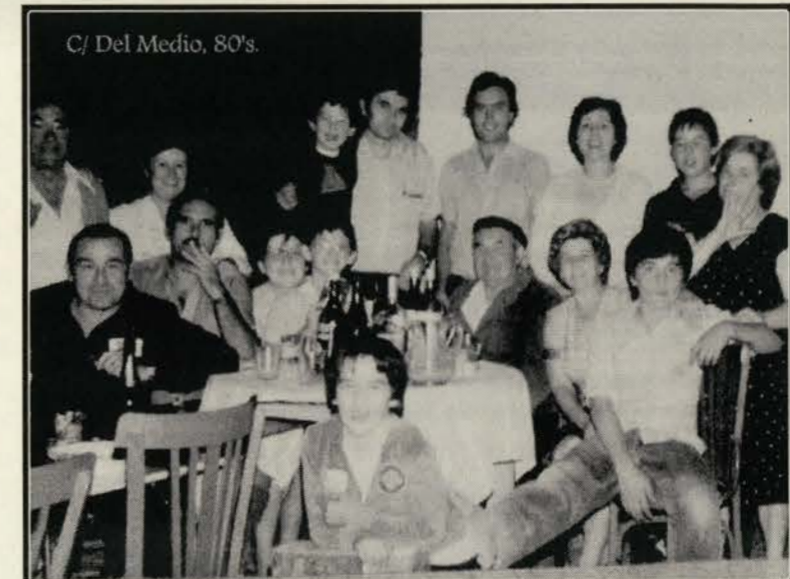
C/ DEL MEDIO, 80'S

Unos cuantos de nuestros queridos vecinos y familia ya no están con nosotros, pero seguirán vivos en nuestras historias, porque tanto los casbantinos como los que venimos de fuera que ya somos medio adoptados, hemos hecho y hacemos las historias de este pequeño y tranquilo pueblo. ■