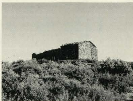
Ermita de Santa Quiteria