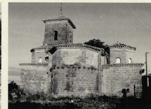
Iglesia de Yaso

también es curioso ver el aspecto alveolado de alguna de las rocas de arenisca, obra del fino cincel de la erosión. Una vez que llegamos al cauce del río tomamos una senda a mano derecha y en pocos minutos arribamos a dicho azud, en el cual es visible que se han llevado trabajos de consolidación, el azud cruza longitudinalmente el cauce sin curvatura y presenta un perfil escalonado con la finalidad de tener una mayor base, también se han colocando escaleras de madera en el talud este para poder descender al cauce y poder realizar una observación más detallada de esta construcción.