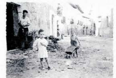
Calle del Horno años 50