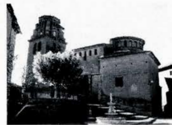
Iglesia y plaza de Sieso

Las cenas de hermandad, como en toda fiesta que se tercie, también las seguimos a rajatabla! La cena informal del viernes cada año tiene más adeptos. Y la cena "oficial" del sábado es ya una maravilla. Los tiempos cambian y ahora ya tenemos que hacerla con catering, pero a nuestros profesionales de la parrilla ya les toca pringar en otros momentos.... Pequeños, medianos y mayores reunidos todos en la mesa con el fin de estar juntos y disfrutar de los nuestros y compartirlos con nuestra gran familia de Sieso.