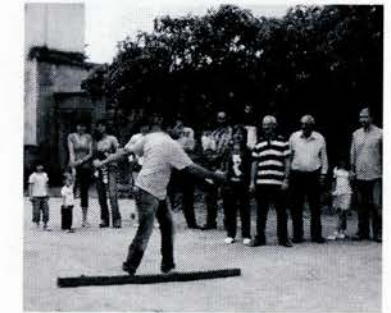
Juegos tradicionales en Junzano

Pero bueno como no soy adivina dejaremos pasar el tiempo y a ver qué sucede, aunque esta cuestión ya no nos preocupa tanto porque desde hace 2 años tenemos un tejado donde cobijarnos, nuestro pequeño pero gran salón ese por el cual suspirábamos en épocas anteriores y que ahora ya tenemos. Faltan algunos detalles para que este definitivamente acabado pero ya se sabe que las cosas de palacio van de espacio.