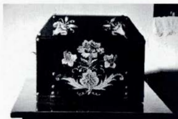
Reliquias de Casbas