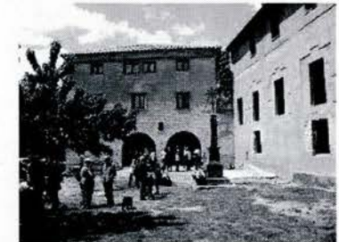
Ermita de san Cosme y san Damián

También cabe mencionar la romería a la ermita de Nuestra Señora de Arraro, también patrona de Panzano, el día primero de Mayo y la romería a San Cosme y San Damián, el día 9 de Mayo junto con los otros 8 pueblos que comparten votos ese día.