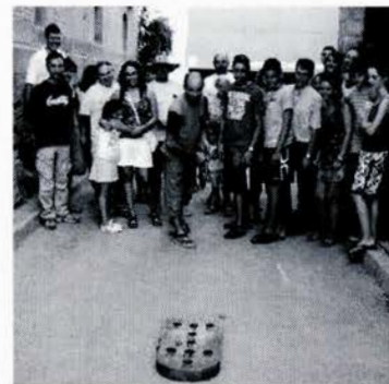
Juegos tradicionales en Sieso

Hemos ido adaptando las actividades al día a día, pero nuestro plato fuerte es la ronda del sábado por la tarde. Una ronda jotera hecha con la gente de casa para la gente de casa. Nos hacen sacar los colores, las lágrimas y el cariño por la gente que desde que empieza hasta que acaba esta allí cantando, bailando, comiendo... disfrutando!!!