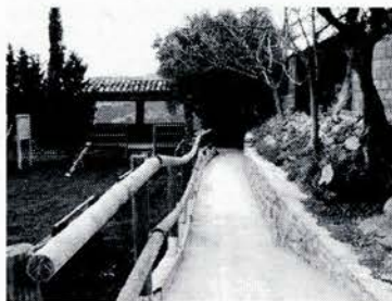
Mirador de Santa Cilia

Como ya viene siendo tradición desde 1993 cuando se acerca el final del verano, para finales de agosto o principios de septiembre, en Santa Cilia organizamos una verbena.