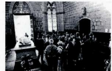
Iglesia de Roncesvalles

Llegó el día 15 de Septiembre. Todavía no se vislumbraba el amanecer y en el Pradal ya estábamos un grupo de personas del Municipio de Casbas, preparados y con gran ilusión para subir al autocar y empezar nuestra excursión que esta vez nos llevaría fuera de Aragón e incluso fuera de España. El autocar recogió en Huesca el resto de personas de la excursión y empezamos nuestra ruta.