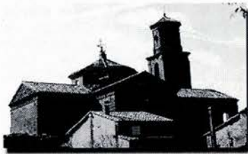
Iglesia de Casbas

A pesar de todo lo sucedido, hemos visto como levantaba cabeza y se animaba. Sobre todo lo hemos podido apreciar en la respuesta que hemos recibido tanto en Diciembre como en Marzo con motivo de las fiestas de Casbas.