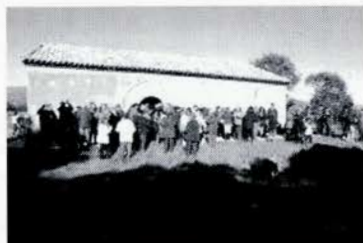
Ermita de Santa Lucía

En la primera este año las fiestas comenzaron con un gran bandeo de campanas y unos cohetes que despertó a la villa llamando a la alegría y a compartir los diversos actos que allí estaban previstos: la gran cena popular, donde se comparte algo más que una comida, risas, alegrías, anécdotas o recuerdos, que la acompaña una gran sesión de baile donde los nuevos ritmos se mezclan con los más tradicionales y donde los vecinos muestran sus habilidades bailarinas. A estos actos se les acompaña con el canto de las antiguas coplillas por las calles de la villa sobre las siete de la mañana que finalizan con un almuerzo popular, comienzo de un nuevo día de fiesta.