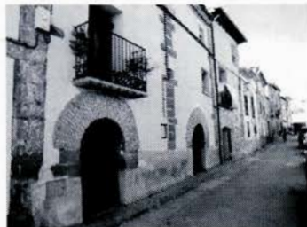
Calle del Horno