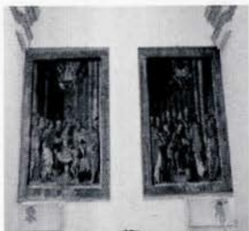
Sargas del altar mayor

Entendemos que una revisión anual, que es lo que se prevé habitualmente en otros modelos de plan de mantenimiento no sería suficiente, al menos durante los tres primeros años, comenzando con 2012. Por ello nos proponemos realizar en 2012, 2013 y 2014, dos revisiones anuales, una después del período de altas temperaturas y menos precipitaciones (septiembre) y otra después del período de menores temperaturas y mayor retención de humedad en el interior del edificio (febrero-marzo).