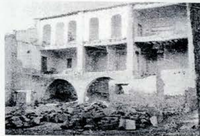
Obras en el Ayuntamiento antiguo