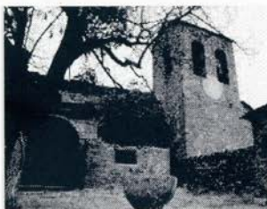
Iglesia de Bara

Te gustaba mucho subir a Bara y a Used, hacer alguna excursión y también viajar.