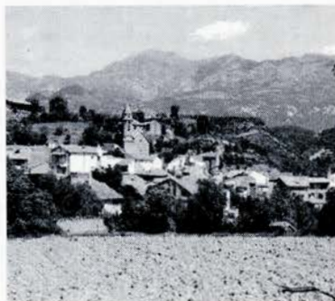
Vista de Labata

Los pasacalles con la charanga de la tarde hace abrir las puertas de las casas con la hospitalidad de sus gentes. En otro momento el melocotón con vino no falta, pues es postre popular y adecuado con la finalización del verano. Meriendas, tertulias, hinchables para los más peques y no tan peques, van adornando unos los festivos actos, todo se adaptado para todos los públicos. Finalmente una traca dará por finalizadas las fiestas por este año y ya pensando en la próxima fiesta. No debemos olvidar la celebración religiosa.