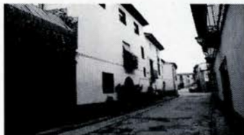
Calle del Horno