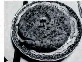
Concurso de tortillas

Durante gran parte del año nos esforzamos y vamos de un lado para otro, para conseguir sacar adelante nuestras propuestas e ideas intentando que el coste económico sea el menor posible para todos.