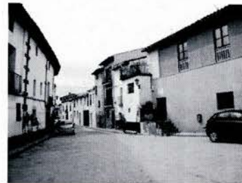
Calle del Horno