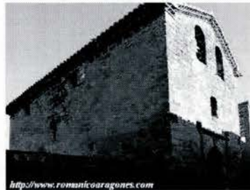
Iglesia de Santa Cilia

Después del café, para pasar la tarde más amena tenemos dos opciones: participar en el torneo de guiñote o participar en el torneo de parchís.