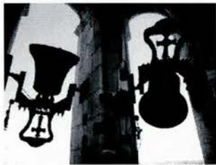
Las campanas marcan fiesta

Las fiestas de los pueblos son momentos de disfrute donde no sólo nos juntamos las personas de los pueblos donde se realizan, sino que todos participamos de una u otra manera. La diversidad de cada uno de nuestros núcleos de población hace que cada uno de nosotros vivamos estos actos de manera diferente. La Hoja Casbantina hemos solicitado a las Comisiones de fiestas de cada pueblo que nos hicieran llegar algún escrito sobre sus fiestas y este ha sido el resultado, de la montaña hacia el plano: