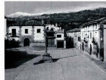
Plaza mayor de Panzano

La fiesta pequeña se celebra el domingo más cercano al 22 de Julio. A las 7h de la mañana, nos juntamos todos en la plaza para salir andando hacia la ermita de Santa María Magdalena. A las 9h se celebra la misa y se cantan las tradicionales coplillas. A eso de las 10h llega el almuerzo, que ya como tradición, consta de migas con huevos fritos. Al final de éste, nos espera una entretenida "sobremesa" al son de jotas y coplillas. Más tarde se canta la despedida a la santa y se regresa al pueblo. Con el paso de los años se han ido instaurando más actividades como la cena y la verbena del viernes, el guiñote y la chocolatada del sábado por la tarde y el vermouth del domingo al regresar de la ermita.