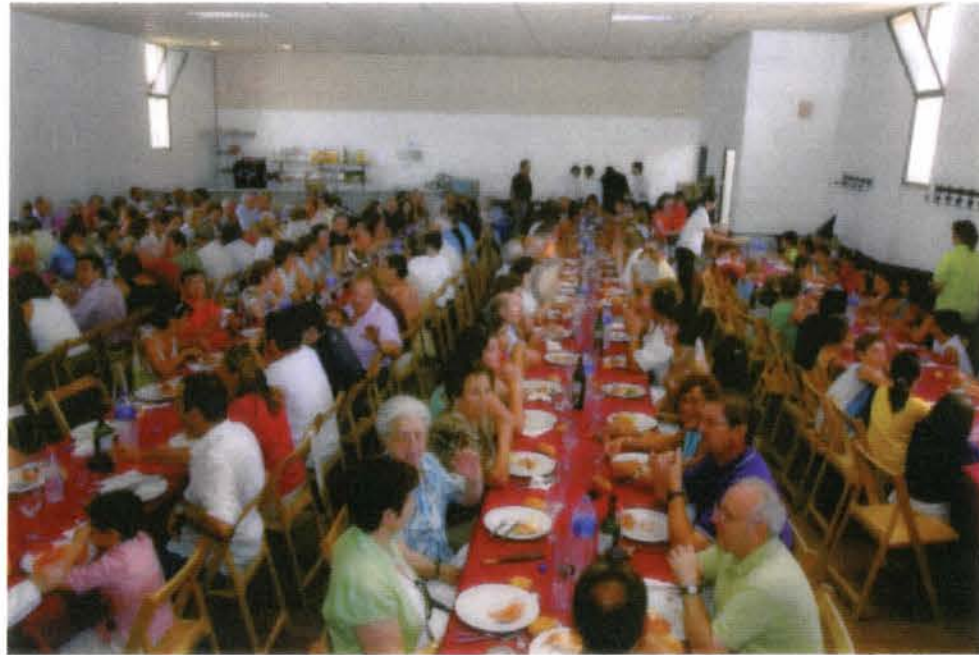
Comida popular del Día del municipio

Los más pequeños pudieron disfrutar con los juegos preparados para ellos en la plaza San Nicolás con las atracciones hinchables. Los más mayores pudieron aprovechar la jornada de puertas abiertas del