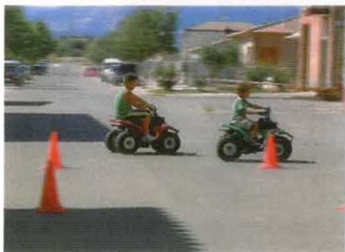
Juegos en el Día del Municipio