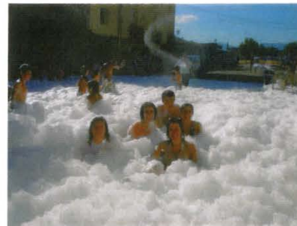
Baño de espuma

“tenemos que seguir participando en futuros años, se realice en el pueblo que sea”