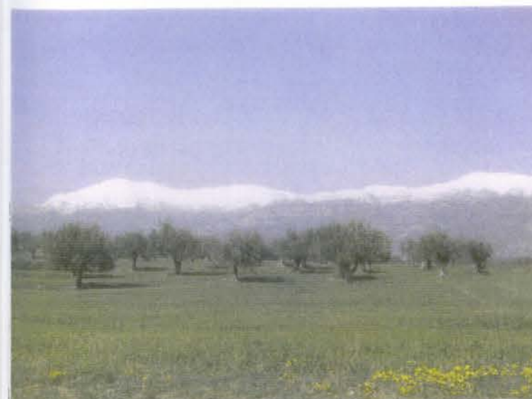
Vistas de la Sierra de Guara

Los que me conocéis algo, sabéis que me gusta ir a carreras de orientación a pie y en bici y hacer aventuras, por ello me veo en la obligación de recordar unas pautas sencillas antes de salir a pasear a pie o en bici, por prevenir. Llevaremos dentro de lo posible con nosotros algo de agua, un teléfono móvil si se dispone de él, que bien utilizado es buen invento algo de abrigo por si nos cambia el tiempo en la ruta o se nos hace tarde y una fruta, frutos secos o una barrita energética, por si nos viene agotamiento. Las gafas de sol, el gorro o gorra, un mapa y una cámara de fotos, son opcionales pero recomendables. Vamos al monte !!!