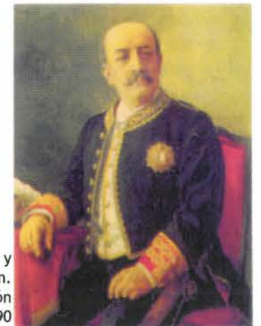
D. Trinitario Ruíz y Capdepón. Ministro de Gobernación en 1890

"La manipulación de votos era una constante"