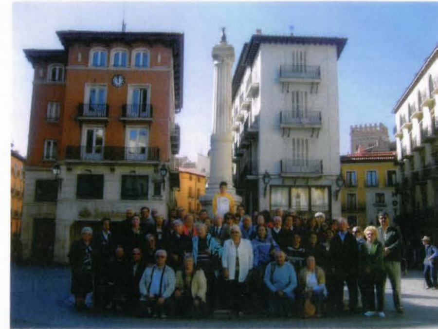
Asistentes al viaje en la plaza del Torico de Teruel

Tras un largo paseo por la ciudad y un poco de