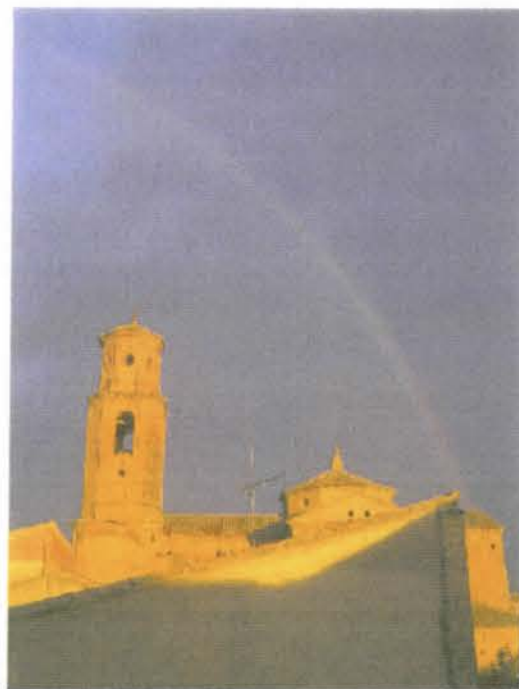
Iglesia de Casbas de Huesca

banco para descansar. Siguiendo la pista, llegamos a una explotación ovina, cruzamos la carretera para adentrarnos en Sieso y tomaremos la pista de la izquierda que nos lleva a Casbas pasando por el repetidor de telefonía que permite enlazar con la "Casa de los Buitres" de santa. Cilia de Panzano. Ya si llegamos con sed o cansados, podemos reponernos en el cuidadísimo y precioso parque de la entrada a Casbas, o en la fuente del Monasterio de Santa. María de Casbas.