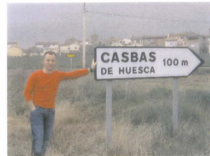
Vistas de la localidad de Casba

A mablemente se me pidió días atrás que participara en ésta revista Nueva Hoja Casbantina, contando alguna ruta a pie o en bici, y yo, aunque no creo que deba ser la persona más indicada para contar los bellos rincones de los alrededores al ser un "recién llegado" -aunque ya voy por el tercer año- me siento enorgullecido de que se me invite a ello, participando encantado y compartiendo lo poco que sé. He creído que se podía plantear aquí y ahora una ruta corta, breve y fácil en ambas disciplinas, pero me gustaría hacer un prólogo que muchos ya conoceréis y otros no tanto.