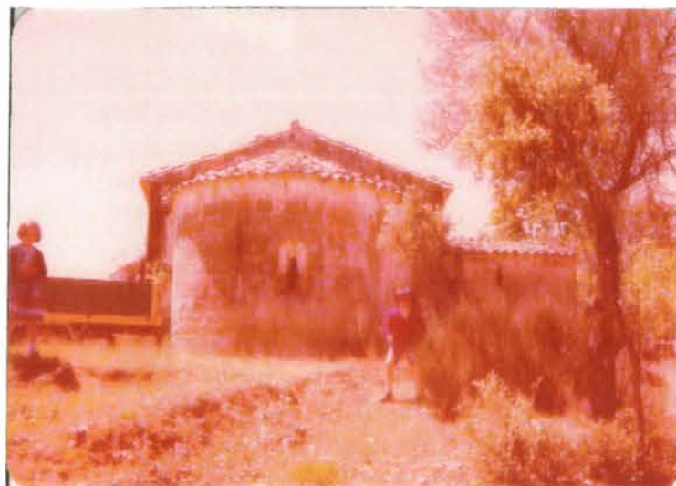
Ermita de Bascués, antes de la restauración

Construidas por los romanos para vertebrar el territorio recién conquistado, más tarde,