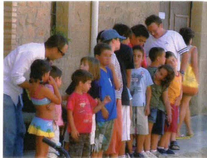
Niños esperando para jugar

A las 4 de la tarde volvía a haber hinchables en los que me lo pase genial saltando y jugando a pressing catch. Cuando se acabaron los hinchables había una fiesta de la espuma en el pradal. Se lleno todo de espuma y te ahogabas fácilmente. Después de la espuma para limpiarnos fuimos a la