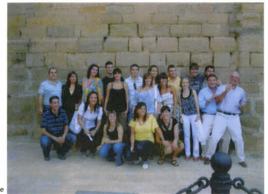
Jóvenes asistentes al Día del Homenaje

“Hubo lágrimas emocionadas durante el acto”