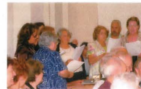
Interior de la iglesia el Día del Homenaje