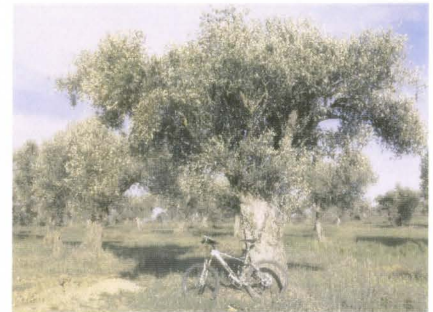
Momento de la ruta

"El municipio es paso obligado de diferentes rutas"