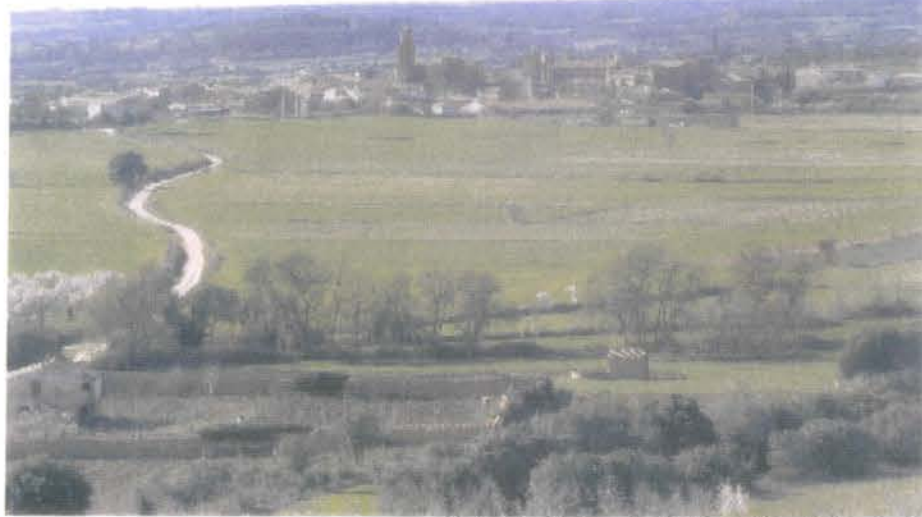
Vistas de Casbas desde la ermita de San José

Ya vamos volviendo, éste es el punto más lejano de la ruta. Tomamos a nuestra izquierda, dirección Sieso. Esta pista, nos muestra la fuente y antiguo lavadero de Sieso, donde tenemos un