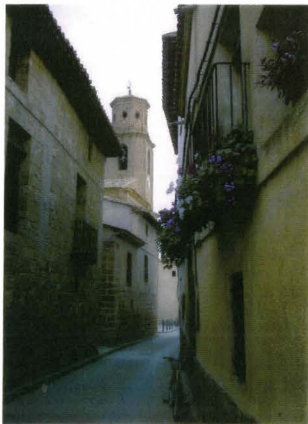
Calle de la Fuente