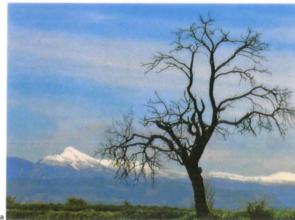
Vistas de la Sierra de Guara

“El municipio de Casbas: del llano a la montaña”