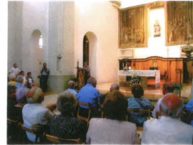
Momento del acto religioso del Homenaje

Día 23 de agosto, hoy no hay siesta, nervios antes de salir de casa, ¿chica, voy bien así? ¿Qué pendientes me pongo? Y a tu padre ¿como lo ves?