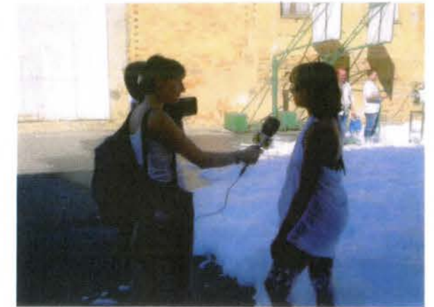
Medio de comunicación en el Día del municipio

mejorando con la experiencia y colaboración de los otros pueblos, que también sabrán aportar todo lo bueno que tienen.