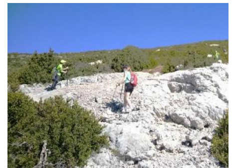
Momentos de la ascensión al Mondinero

La Gloria 5 – 18-05-2024. Ruta S7 Guara Central.