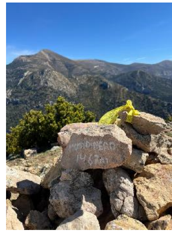
Cima del Mondinero con el fragineto y el Tozal al fondo

Al completar el recorrido los participantes disfrutamos de una frugal comida en las mesas que el Ayuntamiento de Casbas había instalado junto a la casa. En un ambiente agradable y distendido comentamos las anécdotas de la excursión y, para finalizar, nos hicimos una foto de recuerdo con algunos de los participantes.